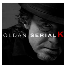
Serial K. (2015)