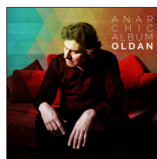
Anar Chic Album (2016)