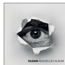
Nouvelles Album (2017)